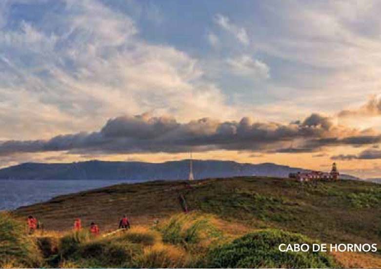
CABO DE HORNOS