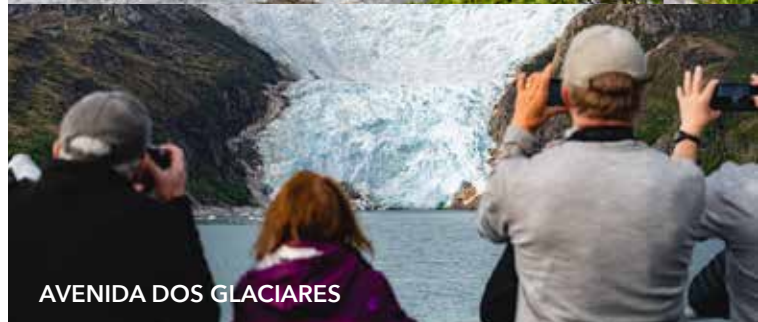
AVENIDA DOS GLACIARES